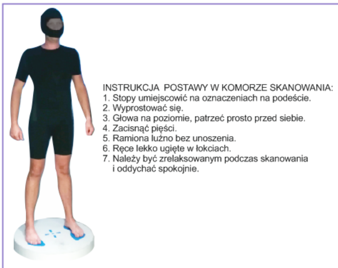
Rys. 3. Instrukcja pozycji w komorze skanera